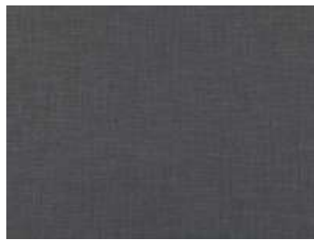
Steeple Grey 7688/07