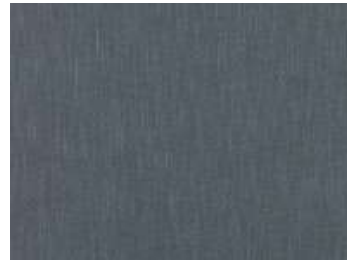
Steel Blue 7688/34