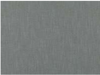
French Blue 7688/32