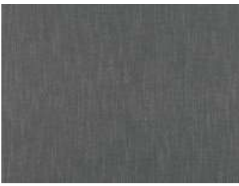
Grey Seal 7688/10