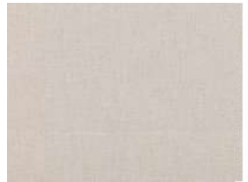
Antique White 7688/28